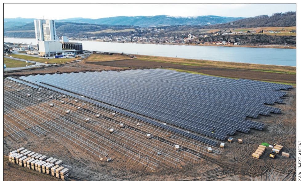
Energie für morgen: Solar Solutions erzeugt seit 2018 grünen Strom.

Strom werden verschiedene Arten der Doppelnutzung erprobt. Unter den PV-Paneelen entstehen wertvoll extensiv bewirtschaftete Biodiversitätsflächen sowie Versuchsflächen, die als Agrar-PV ausgeführt sind. Unter den Solarpaneelen werden beispielsweise Obst- und Beerenpflanzen angebaut. Der gewonnene Strom wird zu 100 % von Garant, dem Futtermittelhersteller der Raiffeisen Ware Austria, für die Produktion und Ladestationen der E-Autos genutzt. Langfristiges Ziel ist es, Kunden ein Gesamtpaket von der Herstellung des Grünstroms durch PV-Anlagen über die Vermarktung bis zum Verkauf beispielsweise durch E-Ladestationen für Autos anbieten zu können.